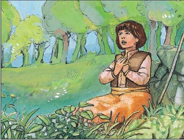
Un jour, Jeanne a entendu des voix.